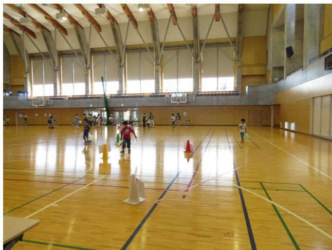
次に5つのコースの「秘密の長さ」を歩いて、歩数から「秘密の長さ」を求めます。