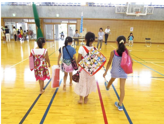
自分の歩幅は何センチ？最初に決められた距離を歩き、自分の歩幅を調べます。

テーマ： 歩いて測ろう！ 決められた距離を歩いて歩数を数え、距離と歩数から自分の歩幅を調べる。次に、「秘密の長さ」を歩いて歩数を数え、自分の歩幅と歩数から「秘密の長さ」を計算により求める。実際に歩測を体験することにより、測量について学ぶ。