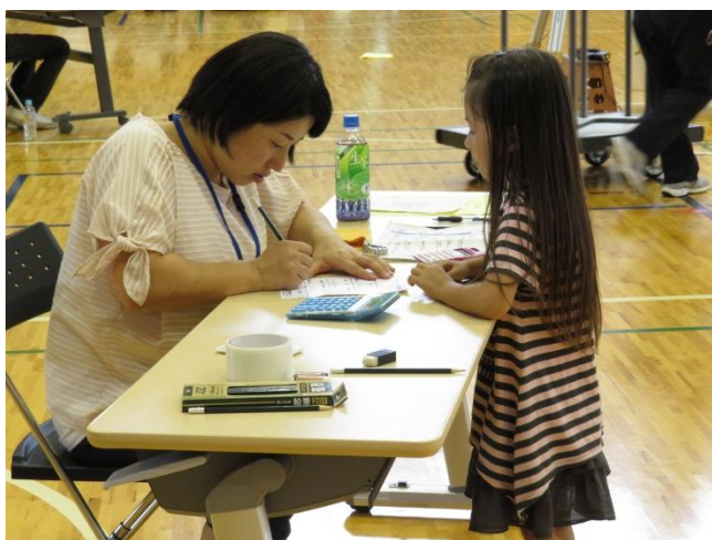
まだ掛け算、割り算を習っていないお子さんの計算は、スタッフが対応しました。