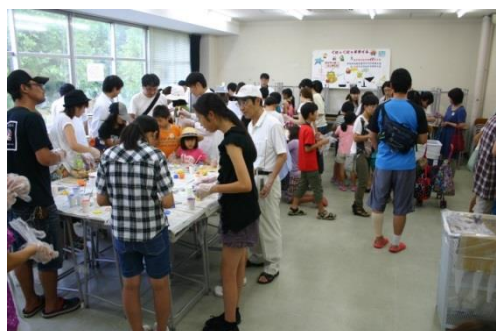
《 ギダイム 》 ふくれて、はねるシリコーン人形