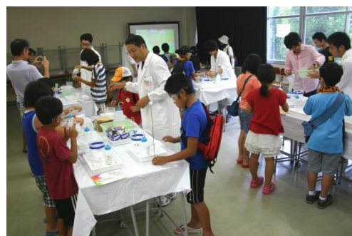
《 冷却パック 》 氷がなくても冷たくなるよ！

今年も、大学祭（技大祭）の 2 日間に開催された理科実験教室「化学のおもちゃ箱 2013」に技術職員 4 名が協力しました。昨年よりもさらに参加者数が増加し、2 日間で合計 1175 名が来場しました。どのブースも大勢の人でにぎわっていました。