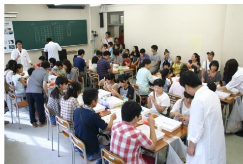
《 プルプルゼリーの芳香剤 》 高吸水性ポリマーで芳香剤を作ろう！