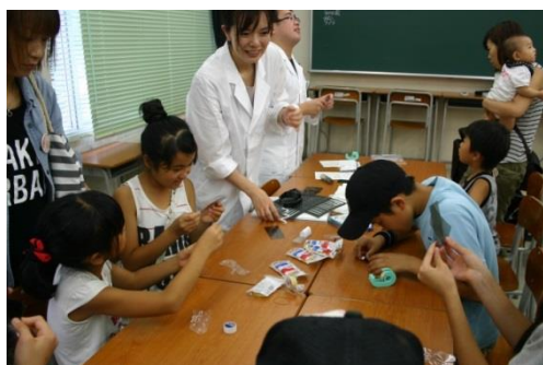
《 科学マジック 》 壁を突き抜ける