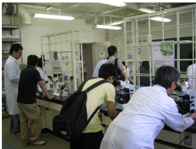
1年生物実験のテーマの1つ、プラナリアや、オオカナダモの顕微鏡観察を実際に体験。