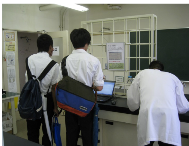
ゲーム感覚でストロープ効果を体験。

実験室では入学後に行う生物実験の説明と実際に生物実験で行う5つのテーマ「細胞の観察」、「プラナリアの観察」、「グラム染色実験」、「土壌生物の観察」、「ストロープ効果の体験」の模擬実験を体験して貰いました。