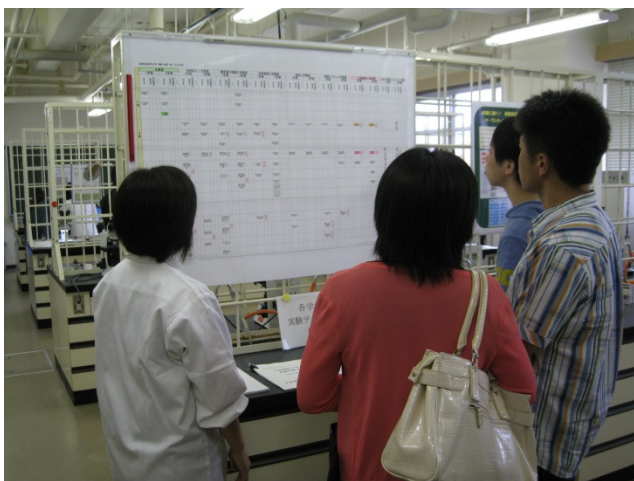
1年学生実験(生物実験)の紹介を、実際の実験室で実施。

テーマ： 生物実験室をのぞいてみよう！ 高校生、高専生や保護者を対象に、学部1年生が履修する生物実験の科目紹介と、「植物細胞の観察、プラナリアの観察、細菌の観察」など5テーマについて、実験を体験して貰いました。