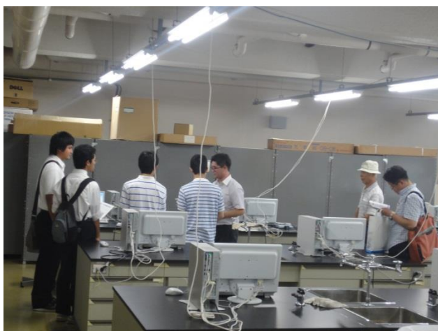
これも物理実験で実際に行うテーマの音叉の 振動数測定を体験。