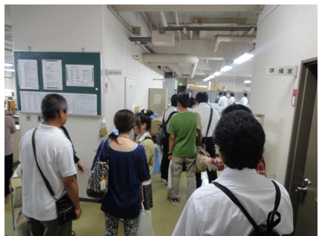
時間帯によっては見学者の行列ができるほど 盛況でした。

実験室では入学後に行う物理実験の説明と実際に物理実験で行う3つのテーマ「重力加速度の測定」, 「音叉の振動数の測定」, 「光の回折・干渉」の模擬実験を体験して貰いました。