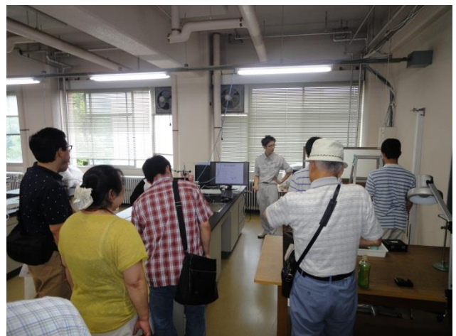
1年物理実験のテーマの1つ、重力加速度の測定 を体験。