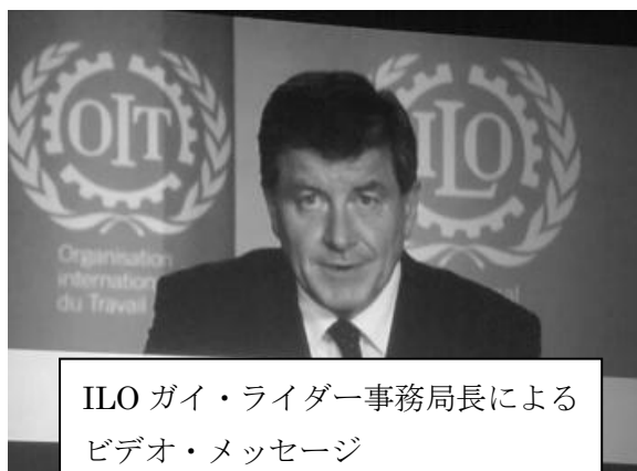
ILO ガイ・ライダー事務局長による ビデオ・メッセージ

1 日目の総合集会および 2 日目、3 日目の分科会において講演や発表を聴講した。